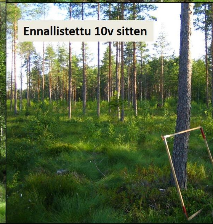
Ennallistettu 10v sitten