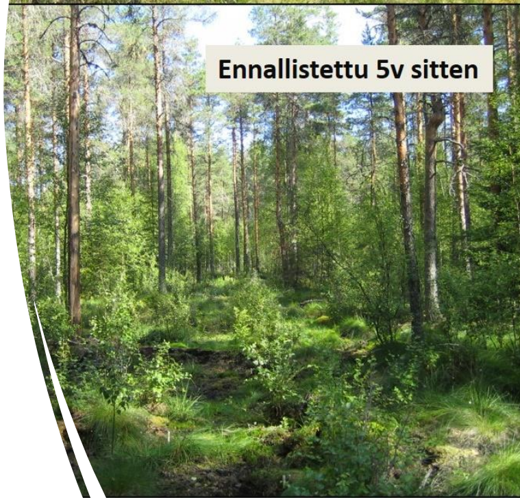
Ennallistettu 5v sitten