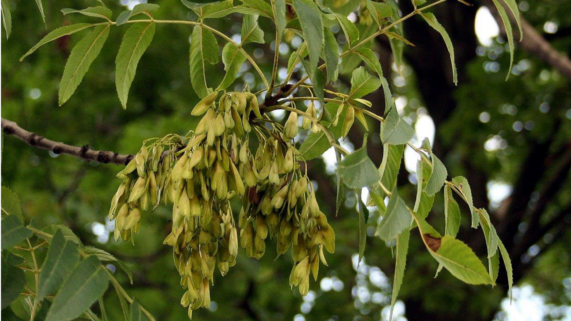
Ask med hängen (Fraxinus excelsior)

Asken har en stark ställning i den nordiska folktron. Världsträdet Yggdrasil som omslöt både gudarnas och människornas boningar var en ask.